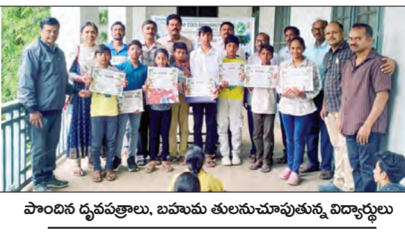
పొందిన దృవపత్రాలు, బహుమతులను చూపుతున్న విద్యార్థులు