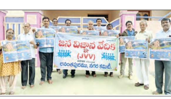
సభ్యత్వ నిమోదా వార్ల పోషణను విడుదల చేస్తున్న డాక్టర్