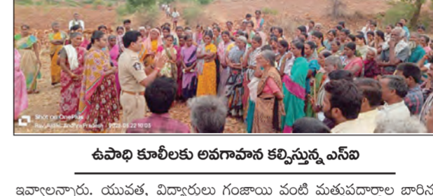
ఉపాధి కూలీలకు అవగాహన కల్పిస్తున్న ఎన్ఐఎ

పెద్దపత్తున, మే 22 ప్రభాతవార్త పెద్దపత్తున మండల పరిషత్ లోని భీమునిపల్లి, రావణడికి గ్రామాల్లో ఉపాధి హామీ పనులు జరుగుతున్న ప్రదేశాల్లో ఎన్ఐఎ ఆంజనేయలు శుక్రవారం పర్యటించి వారికి అవగాహన కల్పించారు. ఈ సందర్భంగా ఎన్ఐఎ మాట్లాడుతూ రోజువారీ పనులు నిమిత్తం ఉపాధి హామీ పనులకు వచ్చే మహిళా కూలీలు, వారి వెంట వచ్చే చిన్న పిల్లల రక్షణ మరియు భద్రత అత్యంత ముఖ్యమని పేర్కొన్నారు. శాంతిభద్రతల పరిరక్షణలో పాలు ఆధునిక నేరాలు, సాంకేతికతపై ప్రజలకు అవగాహన కల్పించడమే ఈ కార్యక్రమం ముఖ్య ఉద్దేశం అన్నారు. మహిళా కూలీలందరూ తమ మొబైల్ ఫోన్లలో "శ్రీ యాస్"ను తప్పనిసరిగా డౌన్లోడ్ చేసుకోవాలని, ఆపరేషన్ సమయంలో ఈ యాప్ మహిళలకు రక్షణ కవచంగా పనిచేస్తుందని వివరించారు. అలాగే మహిళల భద్రత, హక్కుల కోసం ప్రభుత్వం అందిస్తున్న "శ్రీ రక్ష పోర్టల్" గురించి కూలీలకు అవగాహన కల్పించారు. అలాగే డయల్ 100, 112 గురించి అవగాహన కల్పించారు. గ్రామీణ ప్రాంతాల్లో బాల్య వివాహాలు చట్టరీత్యా నేరమన్నారు. ఎక్కడైనా బాల్య వివాహాలు జరుగుతున్నట్లు తెలిస్తే వెంటనే 1098 చైల్డ్ హెల్ప్ లైన్ కు సమాచారం