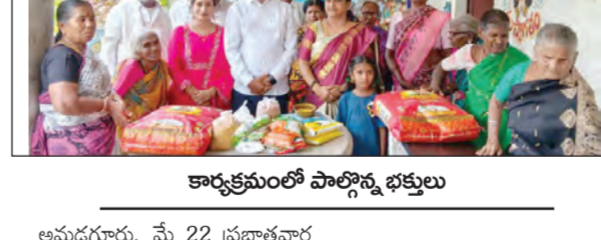
కార్యక్రమంలో పాల్గొన్న భక్తులు

అమడగూరు, మే 22 ప్రభాతవార్త అమడగూరు మండల పరిషత్ లోని బాయిపల్లి చెరువు కట్ట కింద వెలసిన ఏడుగురు అక్కమ్మలకు ఉట్ల పరుసు శుక్రవారం ఘనంగా జరిగింది. ఇందులో భాగంగా కోలాటాలు చెక్కబజలతో అమ్మవారు ఉట్ల పరుసు కొనసాగింది. ప్రతి సంవత్సరం మే నెలలో జరిగే ఈ ఉట్ల పరుసు వేదాది సంఖ్యలో భక్తులు పాల్గొని అక్కమ్మలకు దర్శించుకుంటారు. ఉట్ల పరుసుకు విచ్చేసిన భక్తులకు అన్నదానం కార్యక్రమం భారీగా నిర్వహించారు. భక్తులు అమ్మవారికి తమ మొక్కులు తీర్చిదిద్దగా పూజలు నిర్వహించారు. ఈ ఉట్ల పరుసులో కర్ణాటక, ఆంధ్ర ప్రాంతాల నుండి అనేకమంది భక్తులు పాల్గొన్నారు.