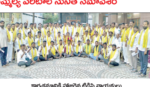
కార్యక్రమానికి హాజరైన టీడీపీ నాయకులు

అనంతపురం, మే 22 ప్రభాతవార్త బ్యూరో తెలుగుదేశం పార్టీ ప్రతిష్ఠాత్మకంగా నిర్వహించే మహానాడును పార్టీ శ్రేణులు విజయవంతం చేయాలని రాష్ట్రాన్ని ఎమ్మెల్యే పరిటాల సునీత పిలుపునిచ్చారు. పొరువు చర్యల్లో భాగంగా తొలిసారిగా వర్చువల్ విధానంలో మహానాడు నిర్వహిస్తున్నట్లు చెప్పారు. మహానాడుకు సంబంధించి అనంత పురంలోనే తన క్యాంపే కార్యాలయంలో పార్టీ నేతలతో సమావేశం నిర్వహించారు. ఈ కార్యక్రమంలో రాష్ట్రాన్ని నియోజకవర్గ మండల కన్వీనర్లు, క్లస్టర్ ఇన్చార్జులు, ప్రధాన కార్యదర్శులు, కో క్లస్టర్ ఇన్చార్జులు, పార్లమెంట్ కమిటీ సభ్యులు, సీనియర్ నాయకులు పాల్గొన్నారు. ఈ సందర్భంగా ఎమ్మెల్యే సునీత మాట్లాడుతూ పార్టీలో పొరువు చర్యలను అమలు చేయాలనే ఉద్దేశంతో టీడీపీ జాతీయ అధ్యక్షుడు చంద్రబాబు నాయుడు వర్చువల్ విధానంలో మహానాడు నిర్వహించాలన్న నిర్ణయం తీసుకున్నారన్నారు. ఈ పనులు ముందుగానే సరికొత్త సాంకేతికతతో అత్యంత ప్రతిష్ఠాత్మకంగా నిర్వహిస్తున్నట్లు చెప్పారు. ఈ నెల 27, 28 తేదీలలో రెండు రోజుల పాటు ఈ డిజిటల్ మహానాడు వేడుకలు జరుగుతున్నాయని, పార్టీ కేంద్ర కార్యాలయం ఖిమ్మిఆర్ భవన్లో కార్యక్రమం ఉంటుంది దన్నారు. ఎన్టీఆర్ భవన్ నుండి ప్రత్యేక స్టేజీని ఏర్పాటు చేసి మహానాడు ఆన్లైన్ కార్యక్రమాలను పార్టీ తీర్మానాలను రాష్ట్రవ్యాప్తంగా అన్ని నియోజకవర్గాలలో క్లస్టర్ వారీగా ప్రత్యేక ప్రసారం చేసారన్నారు. ఈ వేడుకల్లో కేడర్, క్షేత్రస్థాయి