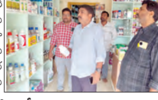
ఎరువుల దుకాణంలో తనిఖీలు నిర్వహిస్తున్న అధికారులు.

జరిగింది. డీలర్లు అందరూ ఎరువులను ఈపాస్ మిషన్ లో సరిచేసుకోవాలని, అడవిదాకా ఎరువుల కృత్రిమ కొరత సృష్టించకుండా ఎంతో పి ధరలతో ఎరువులను అమ్మాలని తెలియజేశారు. దరఖాస్తులను మారుచేయడం వల్ల చర్చలు తీసుకోవడం జరుగుతుంది అన్నారు.