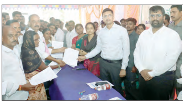
కలెక్టర్ కు సమస్యలను విన్నవిస్తున్న ప్రజలు

నల్లమడ మే 22 ప్రభాతవార్త సమస్యల పరిష్కారం కోసం ఒక నెల ఒక నియోజకవర్గం నాలుగు పక్కటనలు కార్యక్రమం చేపట్టామని వారి సమస్యలు పరిష్కారం అవుతాయన్న ఆశతో ప్రజలు తమ సమస్యలను అధికారుల దృష్టికి తీసుకువచ్చే వారి సమస్యల పరిష్కారానికి సత్కరమే కృషి చేయాలని అధికారులకు జిల్లా కలెక్టర్ శ్యాం ప్రసాద్ సూచించారు. శుక్రవారం పుట్టపర్తి నియోజకవర్గం లోని ఆరు మండలాల సమస్యలపై నల్లమడలో జిల్లా కలెక్టర్ శ్యాం ప్రసాద్ అధ్యక్షతన ఒక నెల ఒక నియోజకవర్గం నాలుగు సమస్యల కార్యక్రమాన్ని స్థానిక ఎంపీడీవో కార్యాలయ ఆవరణలో నిర్వహించారు. ఈ కార్యక్రమానికి స్థానిక ఎమ్మెల్యే పల్లె సింధూర రెడ్డి, జాయింట్ కలెక్టర్ మోర్య శరద్వాణ్, డివిజన్ కోడయ్య, ఆర్.ఓ. సుబ్బ, డీఈవో కిష్టప్ప జిల్లాస్థాయి అధికారులు, డివిజన్ స్థాయి అధికారులు, ఆరు మండలాల తహసీల్దార్లు, ఎంపీడీవోలు, ఎన్టీ శాఖల అధికారులు హాజరయ్యారు. ఉదయం 10 గంటలకు ప్రారంభమైన ఒక ఒక నెల ఒక్క నియోజకవర్గం నాలుగు పక్కటనలు ప్రత్యేక కార్యక్రమంలో జాయింట్ కలెక్టర్ మంత్రి మోర్య శరద్వాణ్ తోలుత ప్రజలకు అర్జీలు స్వీకరించారు. అనంతరం జిల్లా కలెక్టర్ శ్యాం ప్రసాద్, ఎమ్మెల్యే పల్లె సింధూర రెడ్డిలు కార్యక్రమంలో పాల్గొని ప్రజల నుండి వినతులను స్వీకరించారు. నియోజకవర్గంలోని ఆరు మండలాల నుంచి తరలి వచ్చిన ఫిర్యాదులను ఉదాహరణ 139 వరకు తమ సమస్యలపై వినతి పత్రాలు అందజేశారు. ఈ సందర్భంగా కలెక్టర్ మాట్లాడుతూ మండల స్థాయిలో పరిష్కారం చేయవచ్చు సమస్యలన్ని ఎప్పటికీ పుట్ట పరిష్కారించాలని అధికారులకు ఆదేశించారు. ప్రజలకు మెరుగైన పాఠశాల పాలన అంది