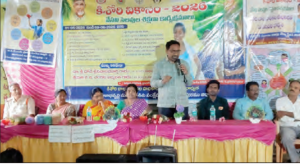
మాట్లాడుతున్న బాలల హక్కుల కమిషన్ సభ్యులు

- ముఖ్య అతిథులుగా ఆంధ్రప్రదేశ్ రాష్ట్ర బాలల హక్కుల కమిషన్ సభ్యులు హాజరు